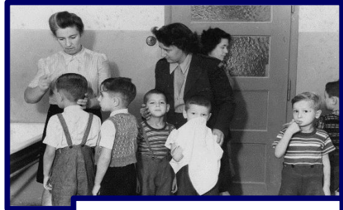
במחנות הפליטים בגרמניה