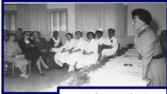
בבי"ס לאחיות מלב"ן